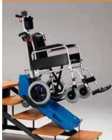
A.R.P. (Ruedas pequeñas en la carcasa)