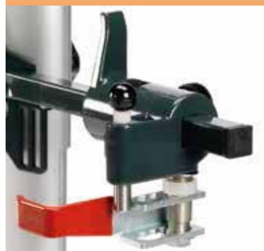
Conexiones ajustables y regulables en altura en altura