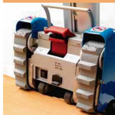
Doble bloque, eléctrico y mecánico, del acoplamiento.