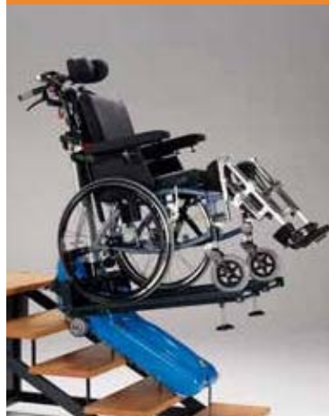
P.P. (Plataforma multifuncional).