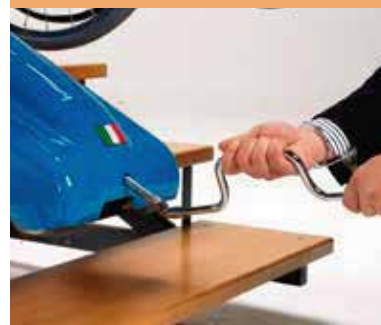
Herramienta de operación manual