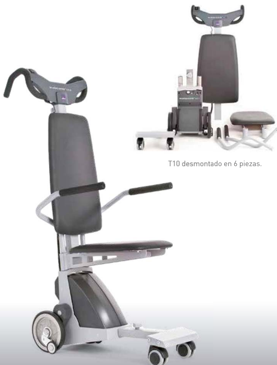
T10 desmontado en 6 piezas.