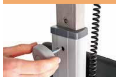
Ajuste de altura del timón